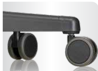
■ lastabhängig gebremste Doppelrollen