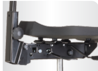
■ stufenlose Rückenverstellung