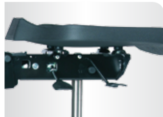
■ verstellbare Sitzflächenneigung