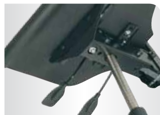
■ griffgünstige Funktionselemente