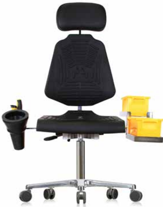
WS 1220 E XL Drehstuhl mit Rollen