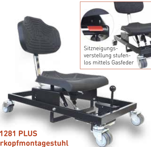
WS 1281 PLUS Überkopfmontagestuhl