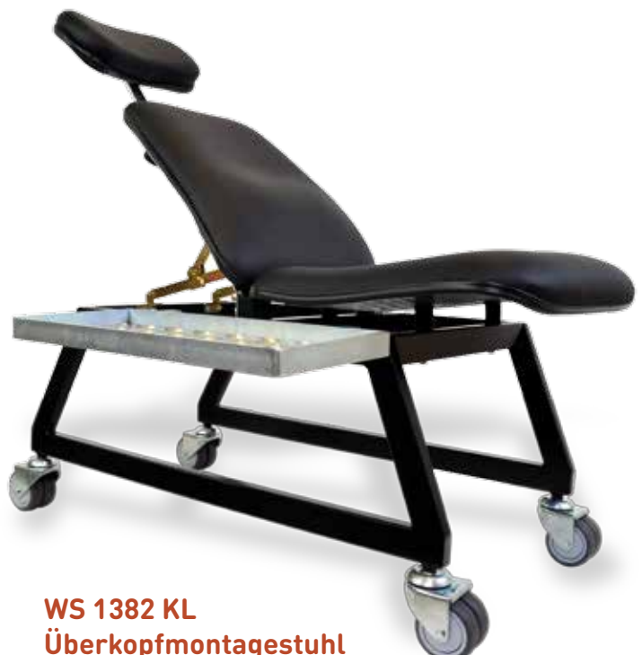
WS 1382 KL Überkopfmontagestuhl