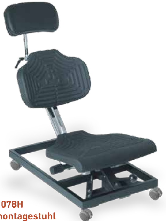
WS 1280 – 078H Überkopfmontagestuhl

Sitzneigungs- verstellung stufen- los mittels Gasfeder