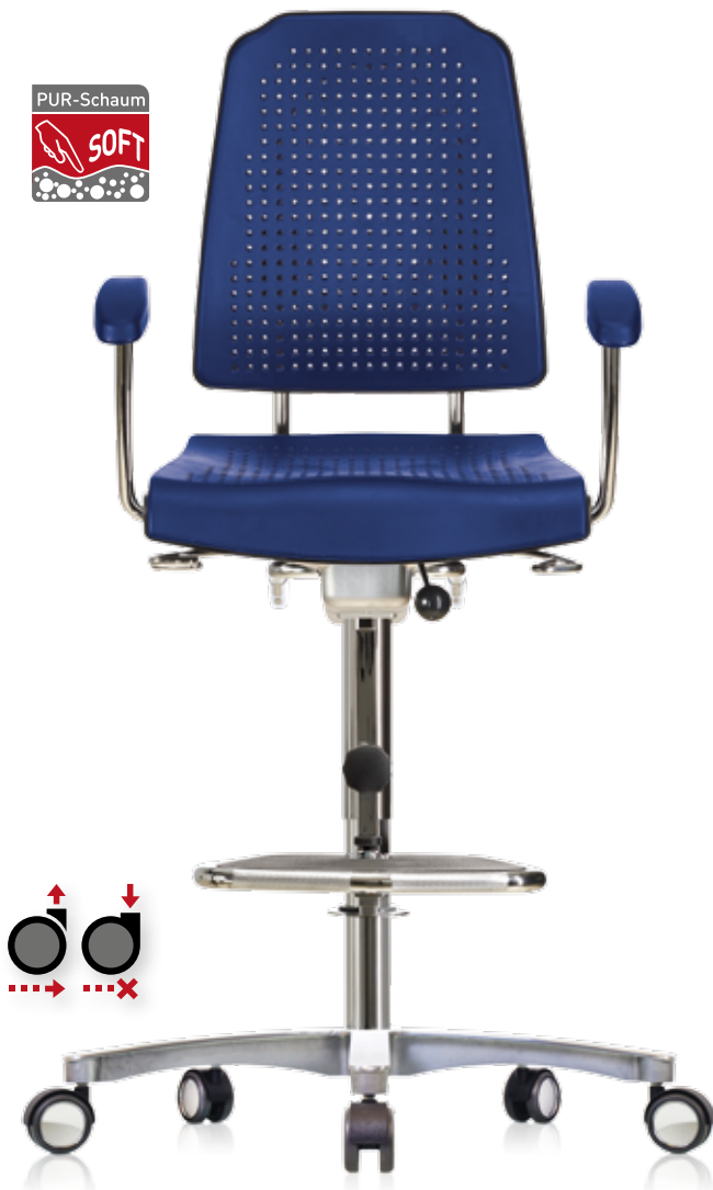
WS 9211.20 ultramarinblau (RAL 5002) mit Soft-PUR-Integralschaum-Polster