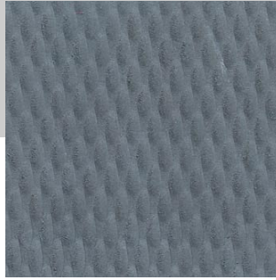
Envers du tapis