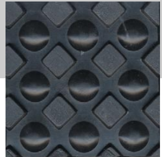
Envers du tapis